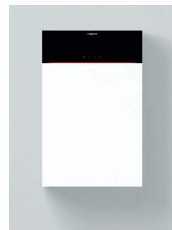
Vitodens 200-W Typen B2HF/B2KF

Komfortable Bedienung auf Augenhöhe durch nach oben versetzbares Display