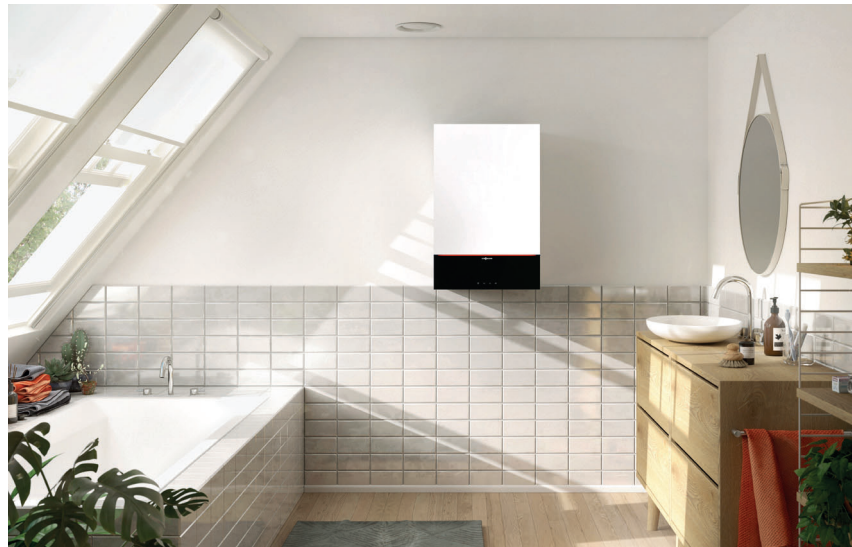
Vitodens 200-W mit attraktivem Design in der Farbe Vitopearlwhite

Vitodens 200-W ist das ideale Gas-Brennwert-Wandgerät für die Eigentumswohnung oder das Einfamilienwohnhaus. Es lässt sich problemlos in einer Nische im Badezimmer oder in einem Küchenschrank montieren. Vitodens 200-W ist mit einem Inox-Radial-Wärmetauscher aus hochwertigem Edelstahl ausgerüstet. Er garantiert Zuverlässigkeit und eine dauerhaft hohe Brennwertnutzung. Das gilt auch für den Matrix-Plus-Brenner.