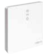
Vitoconnect mit Anschlüssen für das Steckernetzteil (links) und zur Datenverbindung

ViCare greift zur Regelung des Wärmereizers auf die Internet-Schnittstelle Vitoconnect zu. Nach der Freigabe durch den Anlagenbetreiber hat der Fachpartner mittels Vitoguide die Anlage seines Kunden immer im Blick.